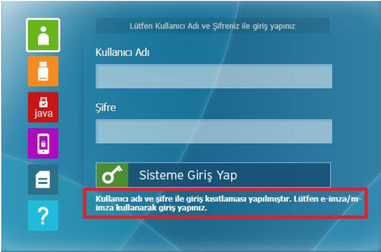
Şekil 1.2 Kullanıcı Giriş Şekli

Seçiminizi yaptıktan sonra “Kaydet” butonuna basınız.